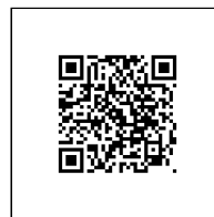
Zažádejte o vytyčení

Přílohy: Orientační zakres plynárenského zařízení, Detailní zakres plynárenského zařízení, Ověřená příloha žadatele